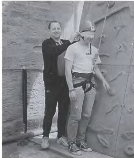
Die Seilschaft hält auch den »Blindgänger«.

Die Einschätzung zeigt, daß hier echte Bindung zwischen den Klassenkameraden entstanden ist, eine positive Erlebnisqualität, die durch aktives, risikoreiches, gefahrenüberwindendes gemeinsames Handeln entstanden ist. Echte Bindung entwickelt sich also durch gemeinsames Handeln und nicht durch