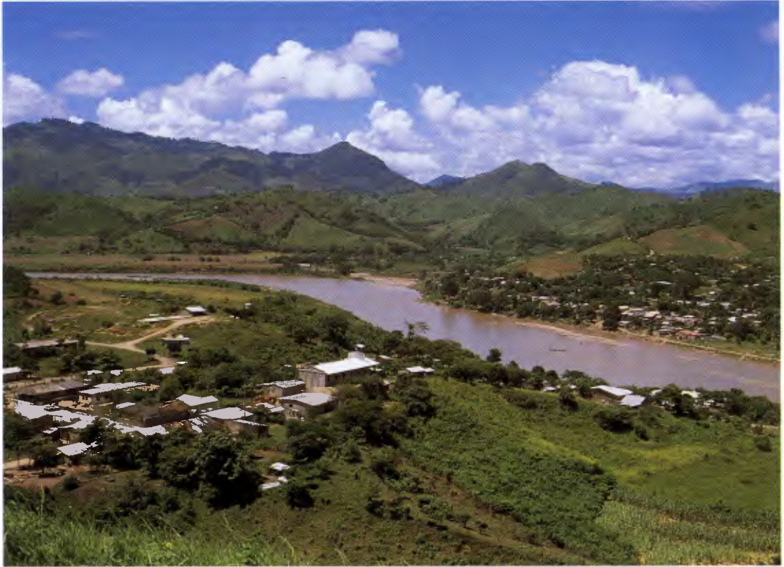
Schwer getroffen: Der kleine Ort Wiwili

stört und die Äcker fortgeschwemmt waren. Ein unbeschreibliches Leid war über diese von der Weltwirtschaft als „sehr arm“ eingestuft Landstriche hereingebrochen.