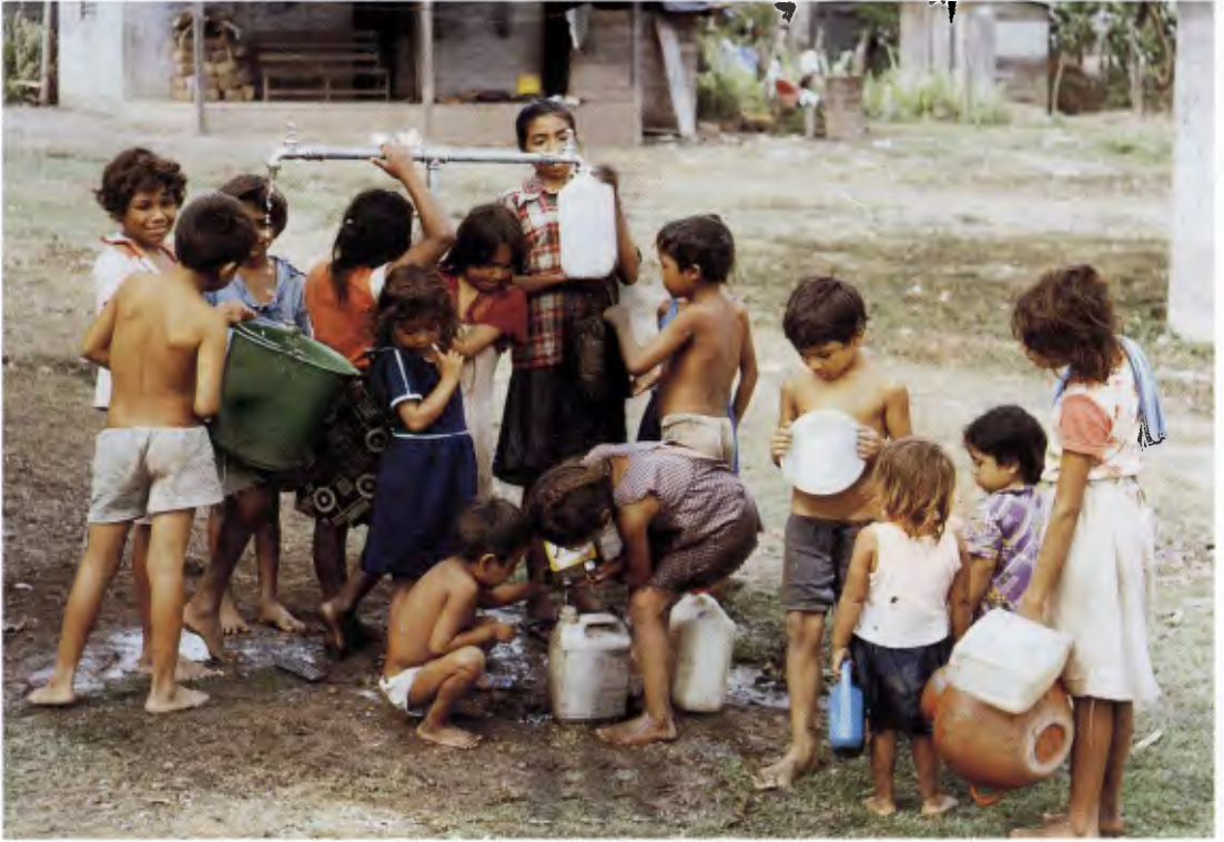
Die Wasserversorgung in Wiwili vor dem Bau der Wasserleitung

Weg bahnte. Am Ende einer Kurve eine Straßensperre, der Fahrer mußte anhalten. Bewaffnete in olivgrünen Tarnanzügen zerrten die Businsassen auf die Straße. Ein kurzes Kommando, dann Feuerstöße aus den automatischen Waffen der Bewaffneten auf die im Straßengraben kauenden Insassen des Busses. So schnell wie sie aufgetaucht sind, waren die bewaffneten Männer der „Contra“ wieder verschwunden. Zurück bleiben 14 kaltblütig ermordete Menschen, die einen unterwegs zu einer 1. Mai-Feier, die anderen unterwegs zu einer Impfkation. Die Ermordeten – allesamt un-