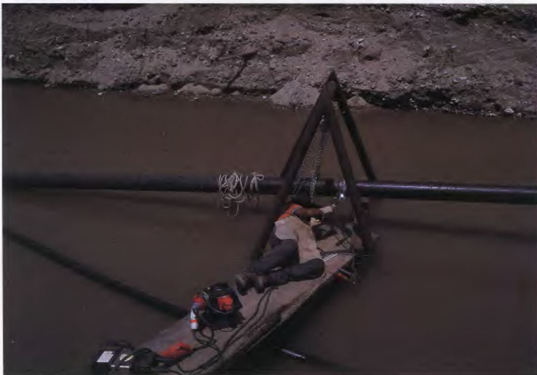
Knochenarbeit: Bau der Wasserleitung nach Wiwili

kann für das, was wir selber zu tun haben, wenn es uns ernst ist mit der Solidarität“. Wie kam es zu dieser Solidarität mit Nicaragua, deren erstes deutsches Opfer Tonio Pflaum wurde? Um das Geschehen auf jener Straße am 30. April 1983 zu begreifen und was er damit zu tun hatte, muß man ein Stück weit in die Geschichte Nicaraguas zurückgreifen.